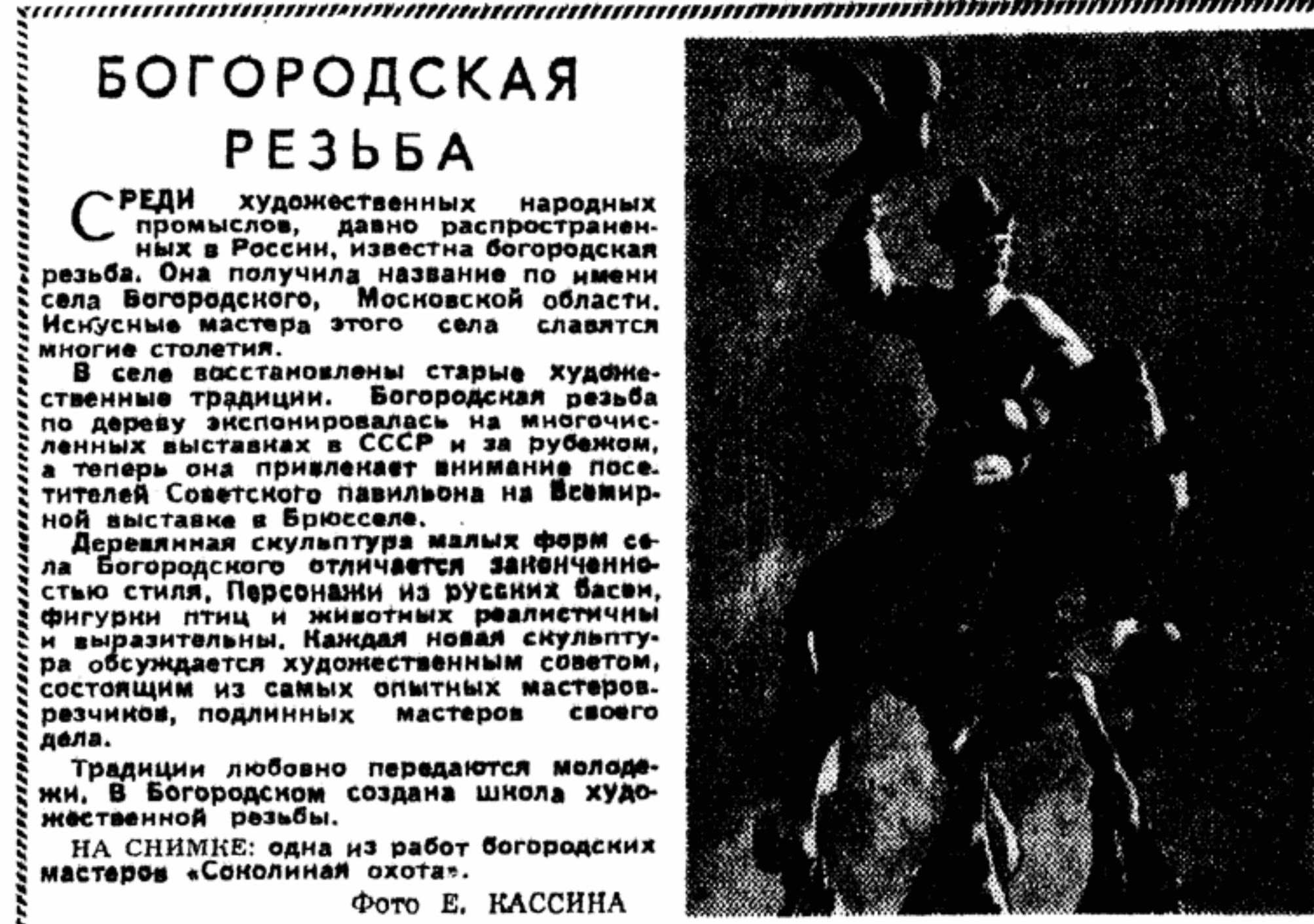
БОГОРОДСКАЯ РЕЗЬБА. Деревянная скульптура малых форм села Богородского отличается завершенностью стиля. Персонажи из русских басен, фигурки птиц и животных реалистичны и выразительны. Каждый новый скульптурный образ обсуждается художественным советом, состоящим из самых опытных мастеров-резчиков, подлинных мастеров своего дела. Традиции любовно передаются молодежи. В Богородском создана школа художественной резьбы. НА СНИМКЕ: одна из работ богородских мастеров «Соколиная охота».

Книгу, которую он читать не хочет. Или не может, потому что ему некогда. И не нужно заставлять. Могу сказать, будто я проповедую какую-то анархию. Это не так. Есть книги, есть вопросы, которые обязательно надо обсуждать. Но для маленькой писательской организации это всегда такие книги, всегда такие вопросы, которые не замыкаются в жаровые рамки. Разве мне, прозаику, не важно уяснить, почему отстают туркменская драматургия? Разве, обсуждая итоги литературного года, например, в поэзии, надо делать так, чтобы поэты в своей секции занимались этим отдаленно, а критики в своей секции, у себя, отдаленно? Разве вопросы воспитания молодых касаются только секции молодых? Ведь наиболее полезные советы писателя могут дать седые писатели — у них и успехов было в жизни побольше, и уж наверняка больше ошибок.